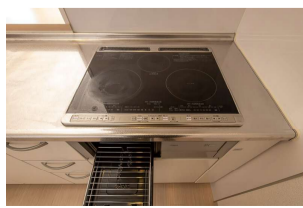
IHクッキングヒーター