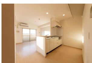
カウンターキッチン